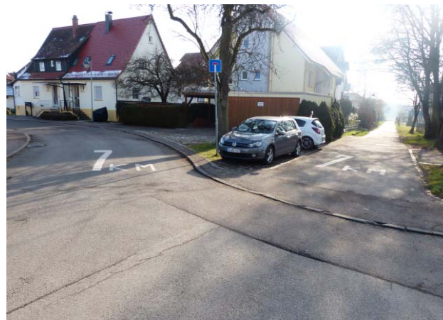
Horbstraße und weitere Zufahrt