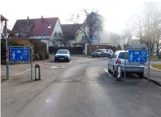
Zufahrt von Horbstraße