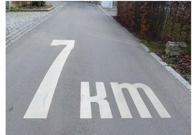
3 Fotos oben: Einfahrt von der Albstraße in die Reußenstraße – Straßenmarkierung 7 km